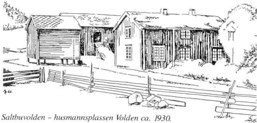
Saltbuvolden – husmannsplassen Volden ca. 1930.